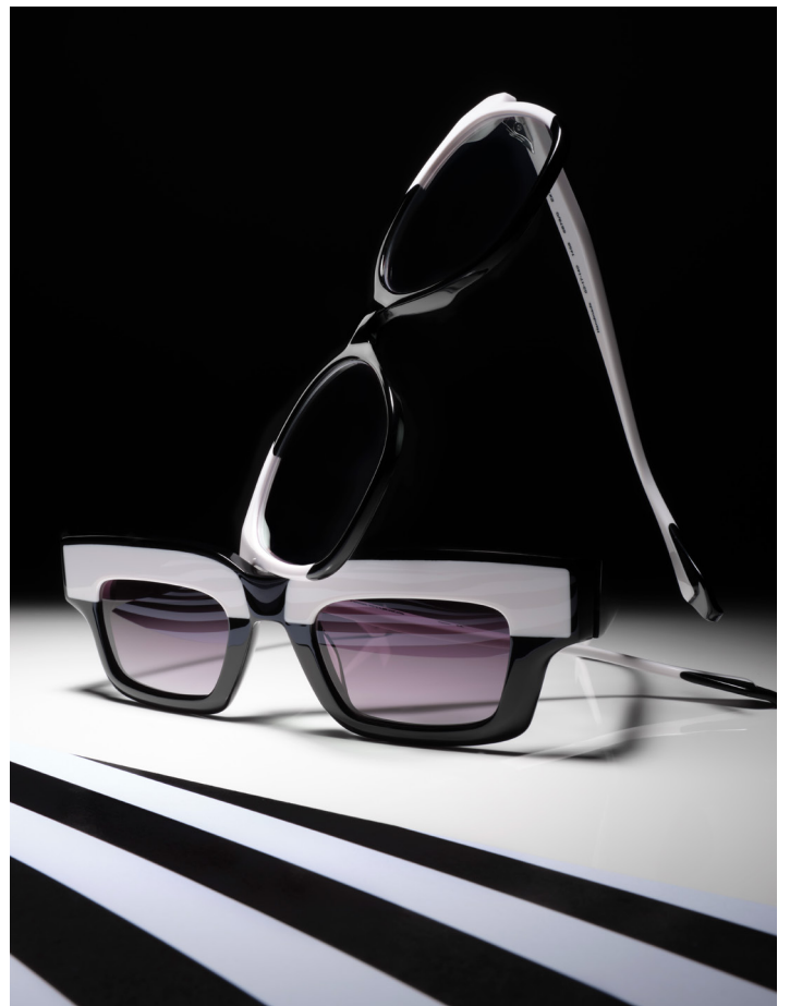
CONTRAST 6875/9 & EXTREME 6878/0